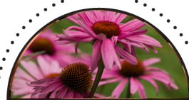
PURPUR SOLHAT ( Echinacea purpurea )