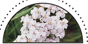
RØLLIKE ( Achillea millefolium )