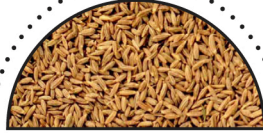
KOMMEN ( Carum carvi )