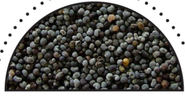
SORTE BIRKES ( Papaver somniferum )