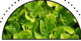
MERIAN ( Origanum majorana )