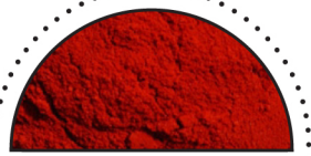
PAPRIKA ( Capsicum annum )