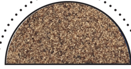
BLACK PEPPER ( Piper nigrum )