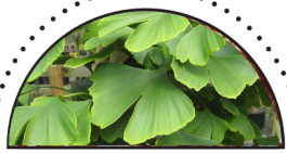
TEMPELTRÆ ( Ginkgo biloba )