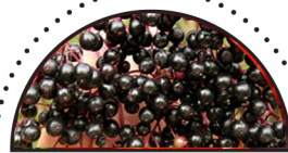
HYLDEBÆR ( Sambucus nigra )