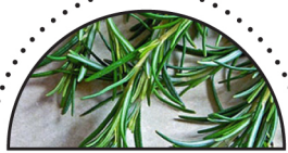
ROSMARIN ( Rosmarinus officinalis )