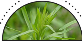
ESTRAGON ( Artemisia dracuncululus )