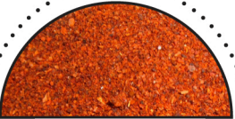
CAYENNE ( Capsicum annuum )