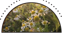
KAMILLE ( Matricaria recutita )