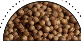
KORIANDEr ( Coriandrum sativum )