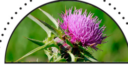
MARIETIDSEL ( Silybum marianum )