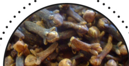
NELLIKER ( Syzygium aromaticum )