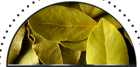
LAURBÆR ( Laurus nobilis )