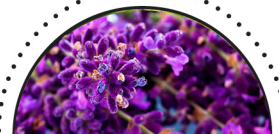
LAVENDEL ( Lavandula angustifolia )