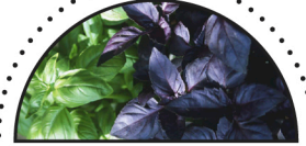
BASILIKUM ( Ocimum basilicum )