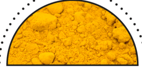
GURKEMEJE ( Curcuma Longa )