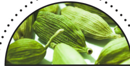
KARDEMOMME ( E. cardamomum )