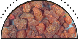
MYRRA ( Commiphora myrrha )