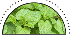
CITRONMELLISE ( Melissa officinalis )