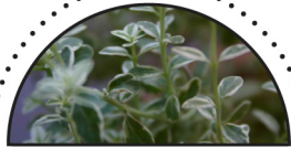
TIMIAN ( Thymus vulgaris )