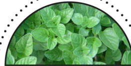
OREGANO ( Origanum vulgare )