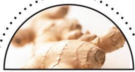
INGEFÆR ( Zingiber officinale )