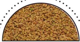
BUKKEHORN ( Trigonella foenum-graecum )