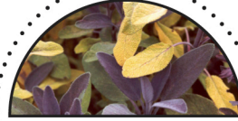
SALVIE ( Salvia officinalis )