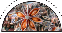
STJERNEANIS ( Illicium verum )