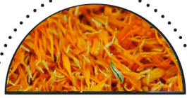
MORGENFRUE ( Calendula officinalis )