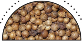
KORIANDE ( Coriandrum sativum )