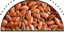
HØRFRØ ( Linum usitatissimum )