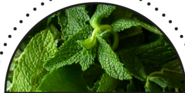
PEBER-MYNTE ( Mentha x piperita )