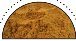
KANEL ( Cinnamomum verum )