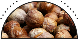
MUSKATNØD ( Myristica fragrans )